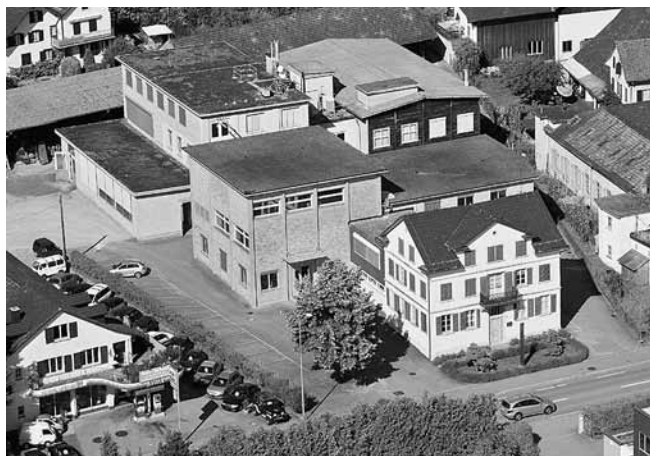
Luftaufnahme Betriebsareal 2008

Eine fortschrittliche Betriebsatzung sorgt für Transparenz, Mitsprache und Teilhabe der über 40-köpfigen Belegschaft. Der Teamgedanke zeigt sich auch im Lohnverhältnis von maximal 1:3 zwischen Lehrabgängern und der Führungsstufe. Dieses Gemeinschaftsgefühl übersetzt sich für Kunden in Kontinuität.